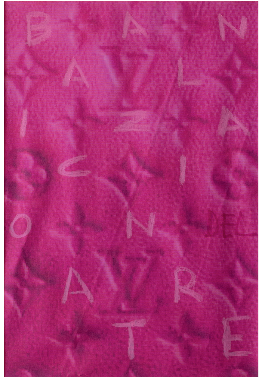
Kike Marín · MCELVI, fotocopia intervenida, 29,7 x 21 cms., 2023