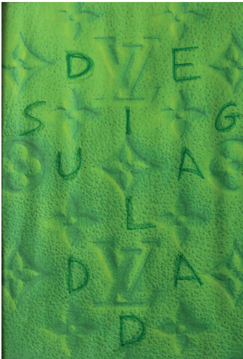
Kike Marín · MCELV2, fotocopia intervenida, 29,7 x 21 cms., 2023