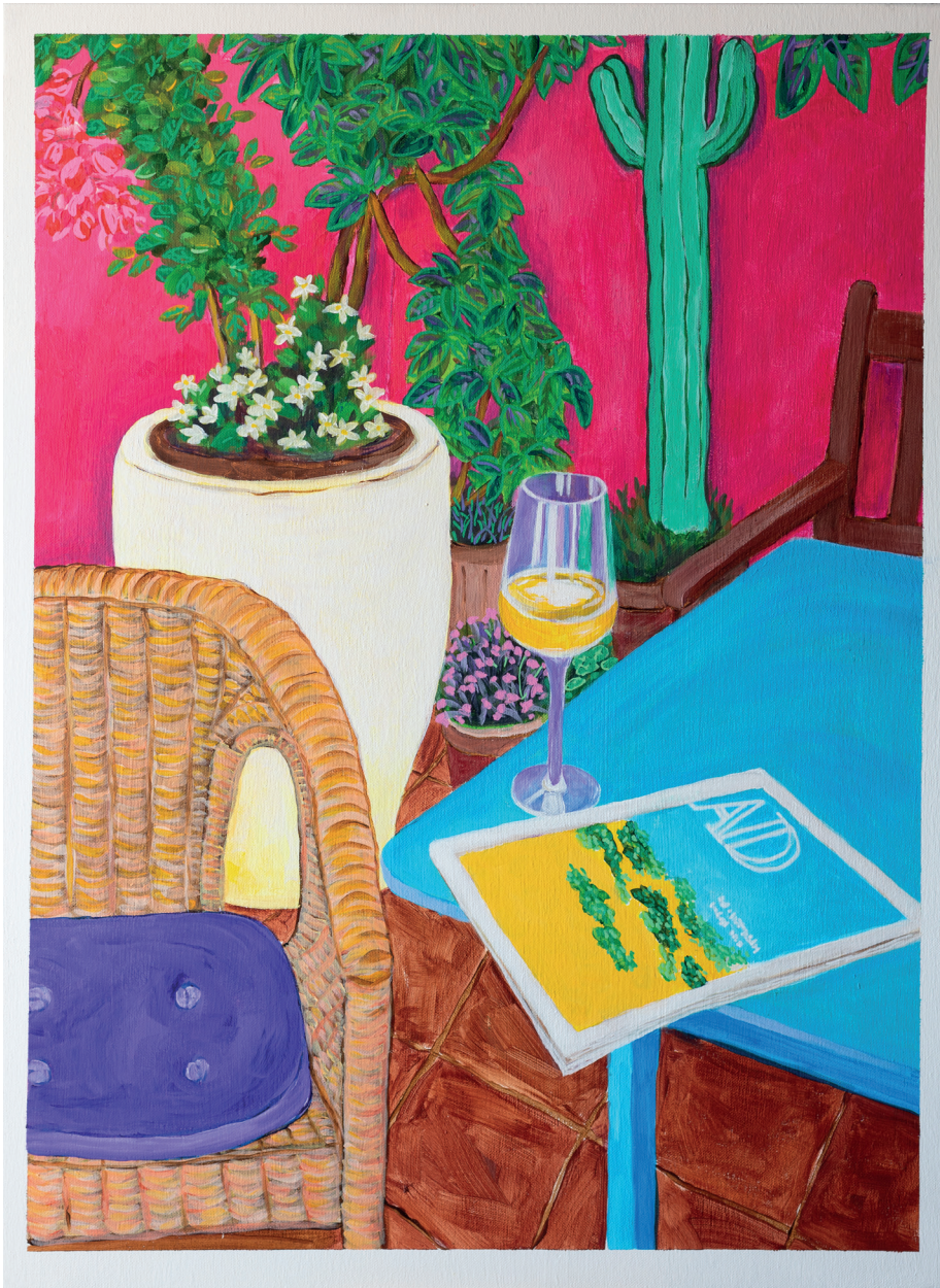
Fernando Batista · El sitio de mi recreo, acrílico sobre lienzo, 80 x 60 cms., 2020