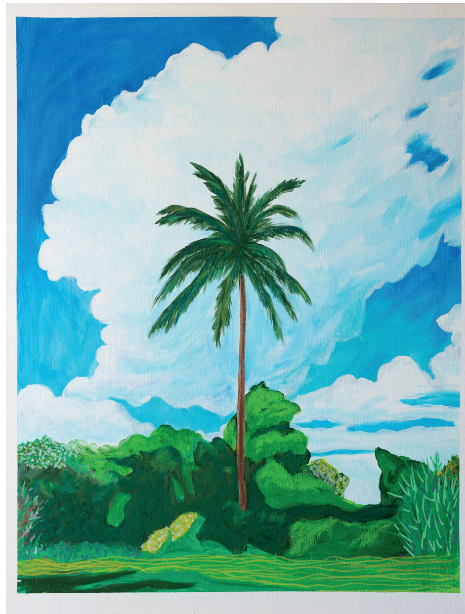
Fernando Batista · Ron del Barrilito, 65 x 50 cms., 2022