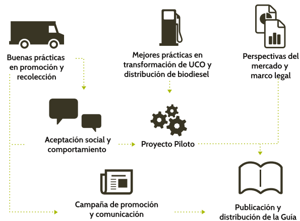
Diagrama de flujo del proyecto.

Se pondrán en marcha proyectos piloto en materia de recogida y transformación de UCOs y comercialización de biodiésel a nivel local. Estos validarán las mejores prácticas identificadas previamente, difundiendo además los resultados del proyecto e impulsando iniciativas similares en otras regiones.